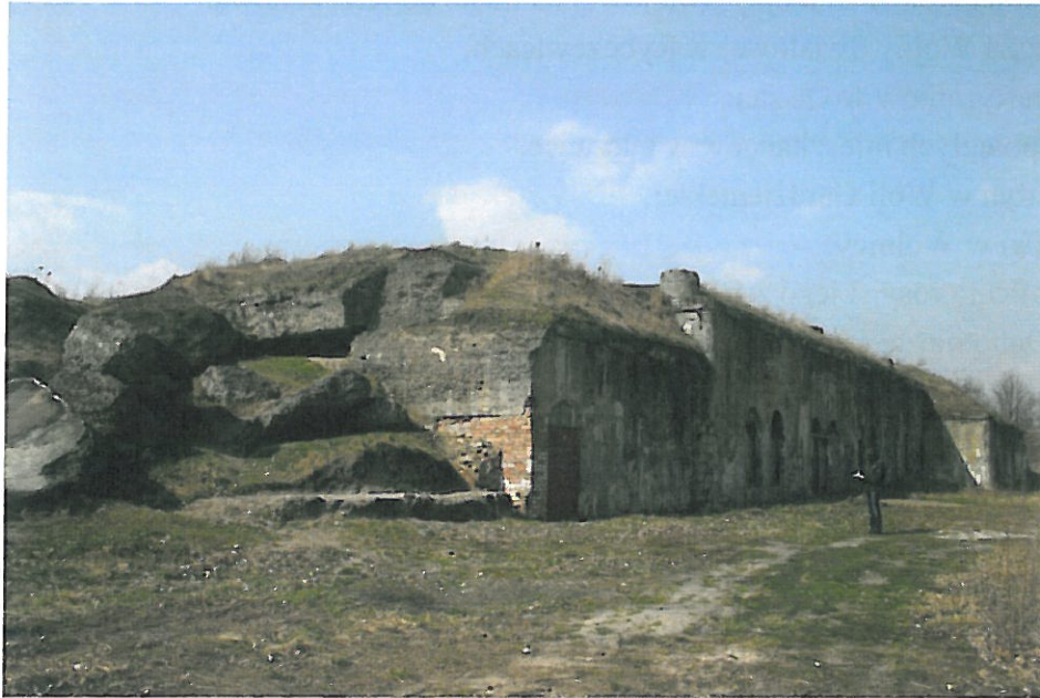
4. Fort VII Twierdzy Brzeskiej

Dokonano inwentaryzacji obiektów dziedzictwa historycznego i kulturowego w parkach krajobrazowych, zebrano dane na podstawie rejestru zabytków, map historycznych i literatury: