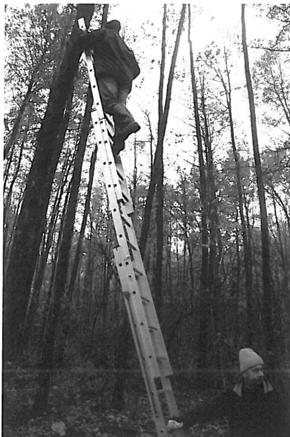
14. Wywieszanie budek lęgowych w Strzeleckim Parku Krajobrazowym

Przeprowadzono również akcję wolontariacką dla 10 pracowników Fundacji CEMEX „Budujemy przyszłość” dotyczącej czynnej ochrony i monitoringu miejsc rozrodu muchołówki białoszyjej w Strzeleckim Parku Krajobrazowym. W ramach akcji wywieszono 20 nowych budek, wyczyszczono wywieszone wcześniej budki – ponad 30 i skontrolowano dotychczasowe zasiedlenie. W wyniku przeprowadzonych czynności ustalono, że w 9 na 35 skontrolowanych budek gnieździła się muchołówka białoszyja, natomiast w pozostałych budkach dominatem lęgowym była sikorka bogatka.