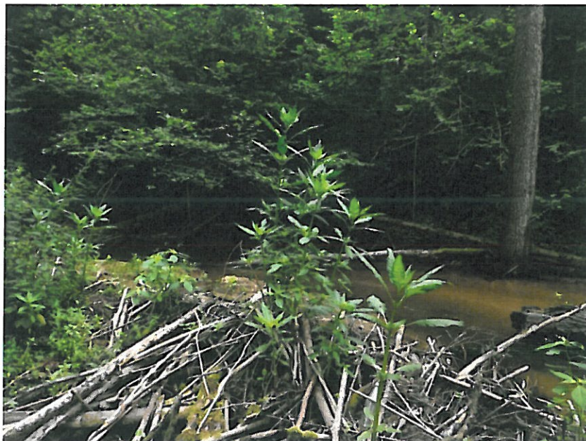
8. Niecierpek gruczołowaty w Parku Krajobrazowym Puszczy Solskiej

Przeprowadzono kontrole pod kątem występowania obcych gatunków inwazyjnych na terenie parków krajobrazowych i obszarów chronionego krajobrazu.