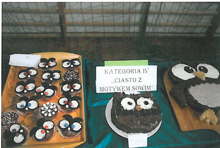
11. Konkurs na ciasto z motywem sowym przeprowadzony w ramach przedsięwzięcia „Nocne nasłuchiwanie sów”

b) - Dzień pszczoły – przedsięwzięcie organizowane wspólnie przez Ogród Botaniczny UMCS i Ośrodek Zamiejscowy Lubartów Zespołu Lubelskich Parków Krajobrazowych. Na stoisku najczęściej emocji wzbudzało koło fortuny, losowanie zagadek i łamigłówek. Przeprowadzono konkursy na najładniejsze przebranie za pszczołę i laurkę z motywem pszczoły.