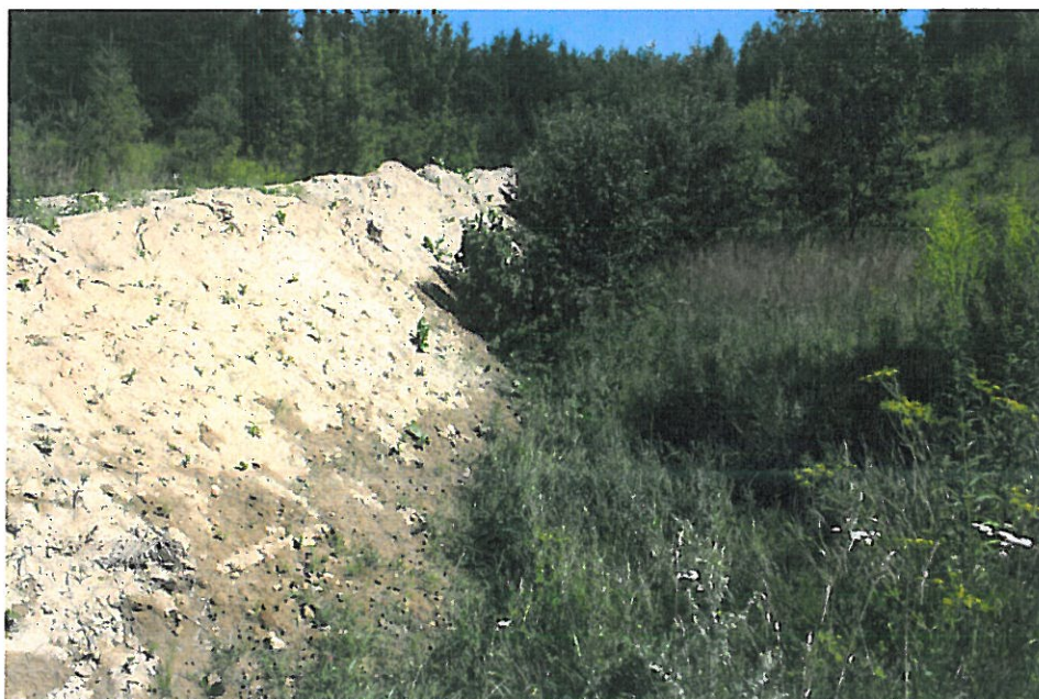
1. Dewastacja wąwozu; nawożenie dużych mas ziemi