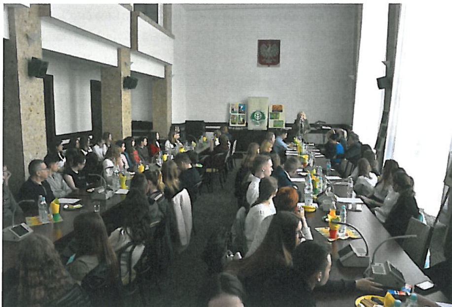
12. Sesja naukowa pt. „Eko – problemy małe i duże” przeprowadzona w ramach konferencji „Zdrowy Człowiek”

16. Organizacja zielonej szkoły we współpracy z Biurem Turystyki „Roztocze Travel” w Zamościu. Zadanie nie zostało zorganizowane z powodu brak chętnych szkół.