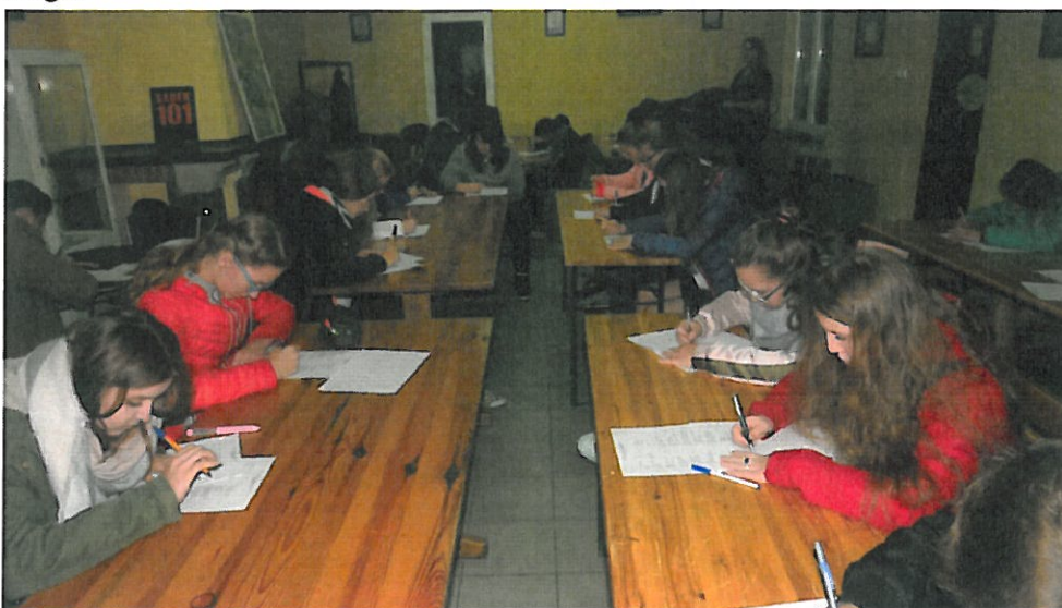
10. Młodzież podczas konkursu pt. „Mieszkańcy lasów, pól i łąk” zorganizowanego w ramach Światowego Tygodnia Zwierząt

- „Światowy Tydzień Zwierząt” – w ramach akcji Zespół Lubelskich Parków Krajobrazowych brał udział w Dniu Zwierzaka w Galerii Twierdza w Zamościu; zorganizowano również konkurs pt. „Mieszkańcy lasów, pól i łąk”, w którym wzięło udział 27 uczniów. Konkurs odbył się na Strzelnicy Myśliwskiej Polskiego Związku Łowieckiego w Kumowej Dolinie koło Chełma. Dla uczestników przygotowano dodatkowe atrakcje, jak np.: pokaz urządzeń łowieckich, wystawy budek lęgowych dla ssaków, ptaków i owadów, pokaz strzelectwa myśliwskiego.