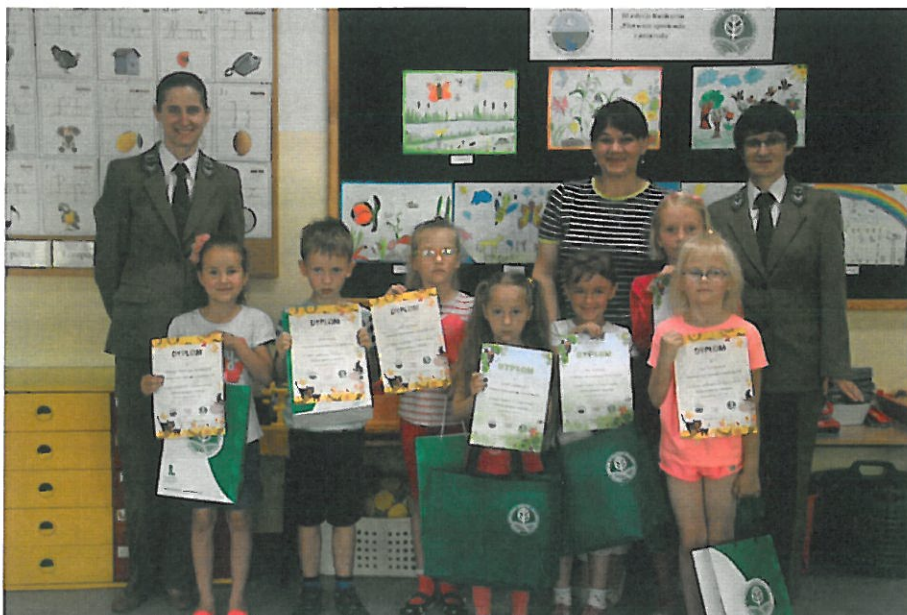
9. Laureaci konkursu „Pierwsze spotkanie z przyrodą”, fot. Pracownik szkoły w Konstanczynie.

- „Karmnik dla ptaków” – konkurs skierowany był do uczniów Szkoły Podstawowej w Konstanczynie (teren Parku Krajobrazowego „Podlaski Przełom Bugu”) i zmotywował aż 48 uczniów z 8 klas, a głównym kryterium oceny prac konkursowych była funkcjonalność ale także pomysłowość, staranność i estetyka wykonania. Ponadto uczniowie z klas I-III wzięli udział w zajęciach przeprowadzonych przez pracownika Ośrodka Zamiejskiego w Janowie Podlaskim, podczas których mogli zapoznać się z gatunkami, które mogą stać się naszymi karmnikowymi gośćmi.