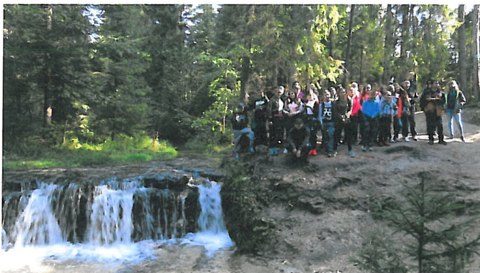
13. Jesienny Rajd po Parku Krajobrazowym Puszczy Solskiej, Fot. P. Łapiński

- z cyklu „Znam Lubelskie Parki Krajobrazowe” – dwudniowy udział w 57-ym Jesiennym Rajdzie po Parku Krajobrazowym Puszczy Solskiej, w którym uczestniczyły 52 osoby.