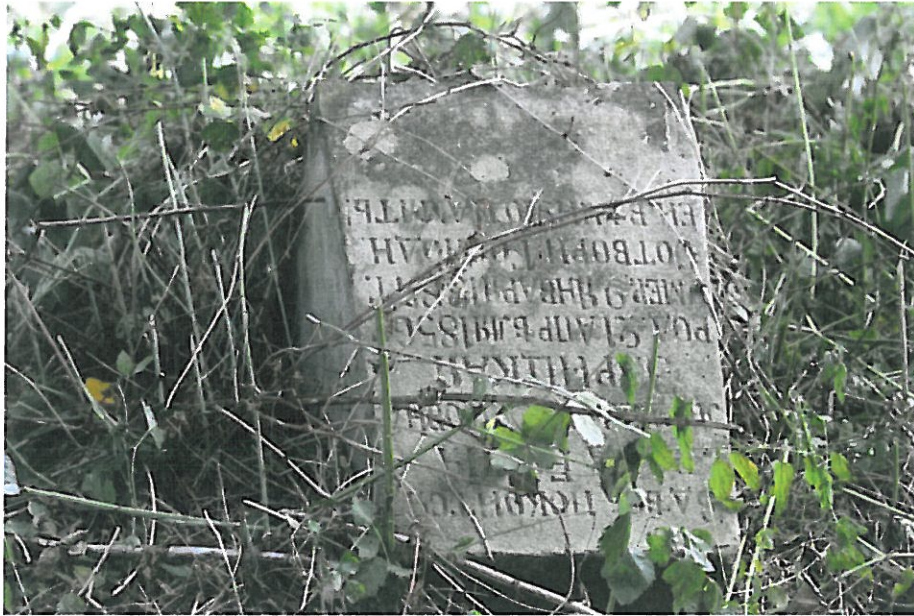
5. Cmentarz prawosławny w Gródku

n) Nadbużański Obszar Chronionego Krajobrazu: