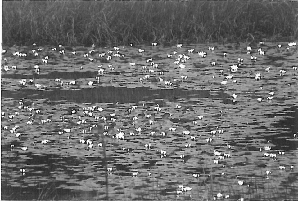
2. Grzybienie białe