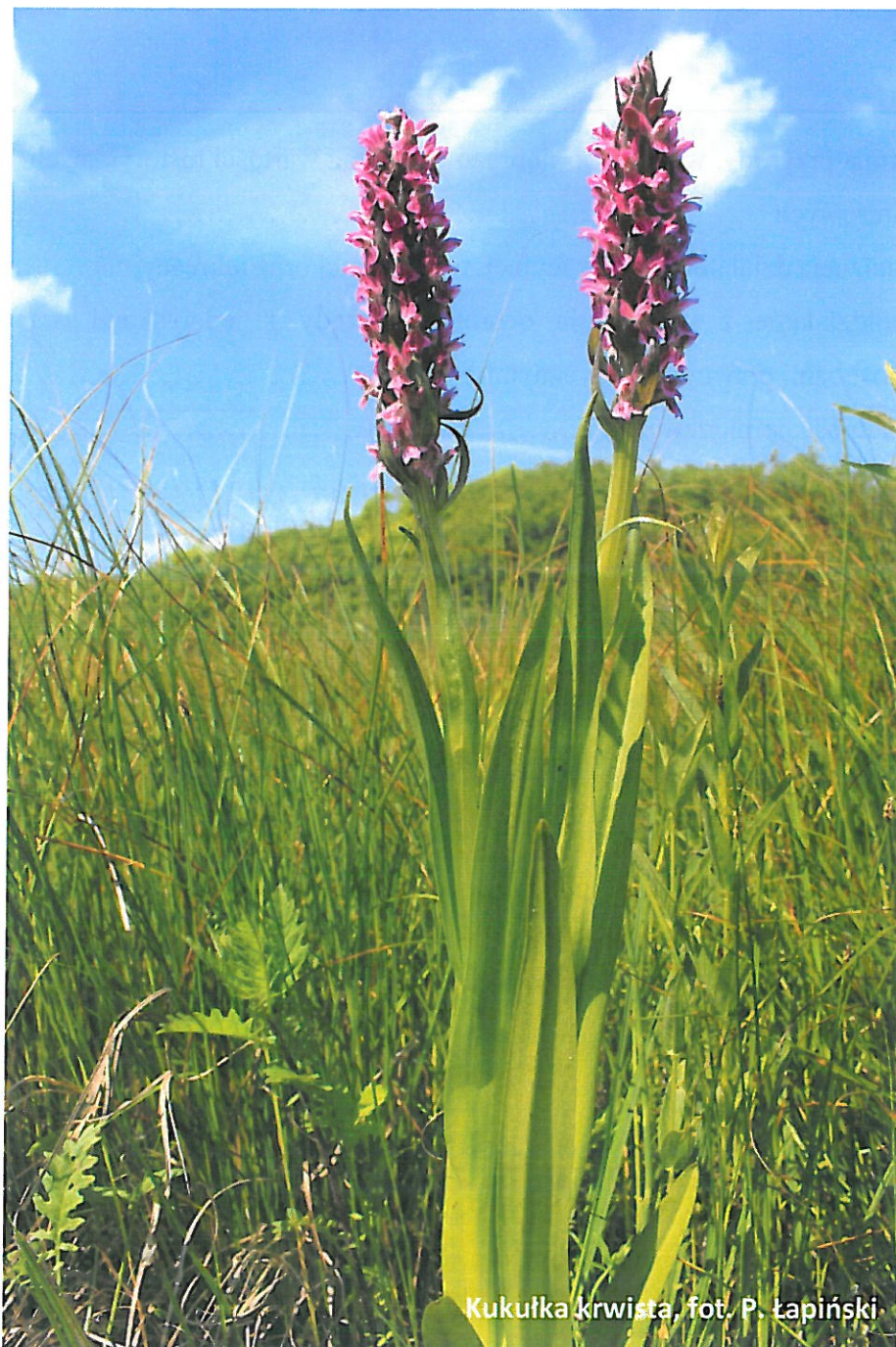
Kukułka krwista