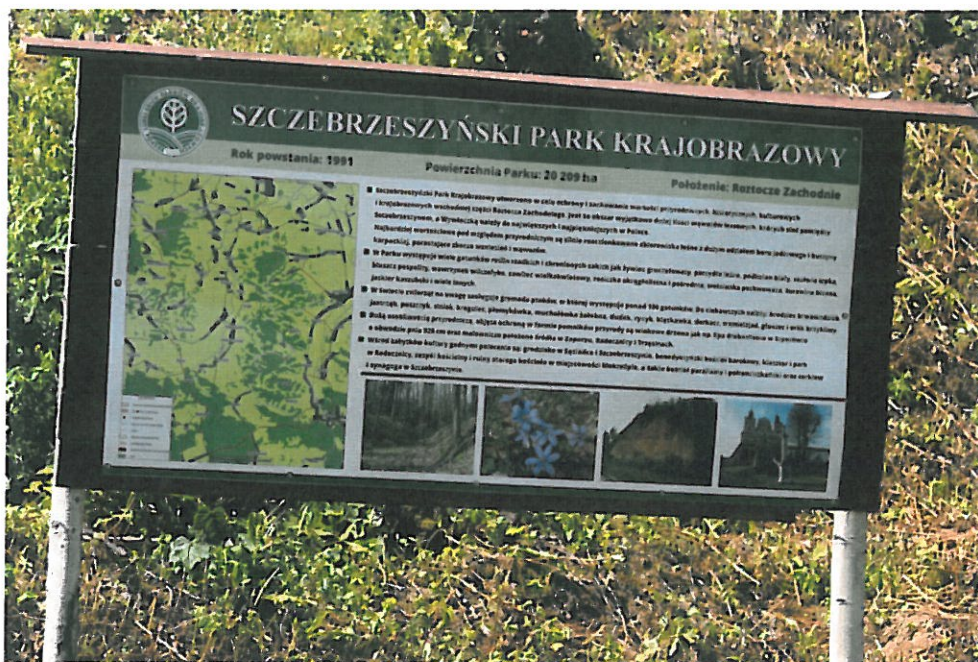
6. Wymiana tablicy informacyjnej w m. Sąsiadka – Szczebrzeszyński Park Krajobrazowy