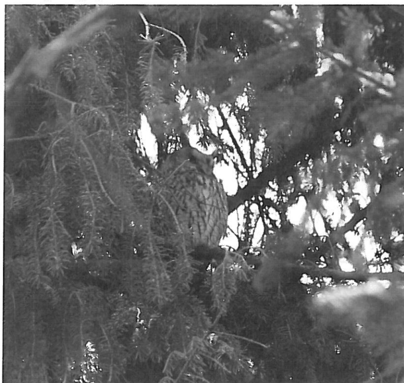
3. Uszatka zwyczajna

h) Park Krajobrazowy „Pojezierze Łęczyńskie”: