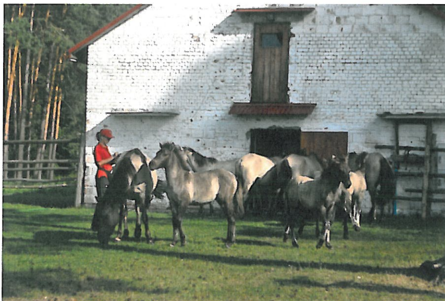
16. Opis i czipowanie źrebaków koni biłgorajskich

Zespół Lubelskich Parków Krajobrazowych Ośrodek Zamiejscowy w Janowie Lubelskim we współpracy z Polskim Związkiem Hodowli Koni przeprowadził opis i znakowanie młodych koni.