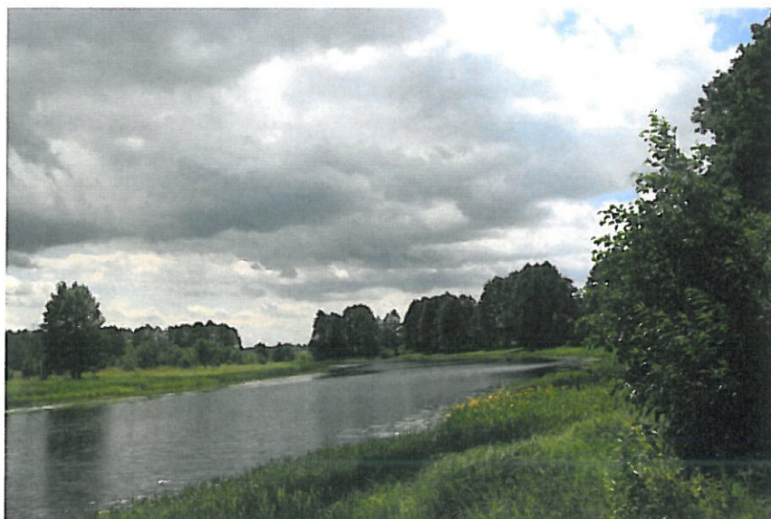
7. Obszar wodno-błotny w Starým Bublu (Park Krajobrazowy „Podlaski Przełom Bugu”), fot. A.Łazeba