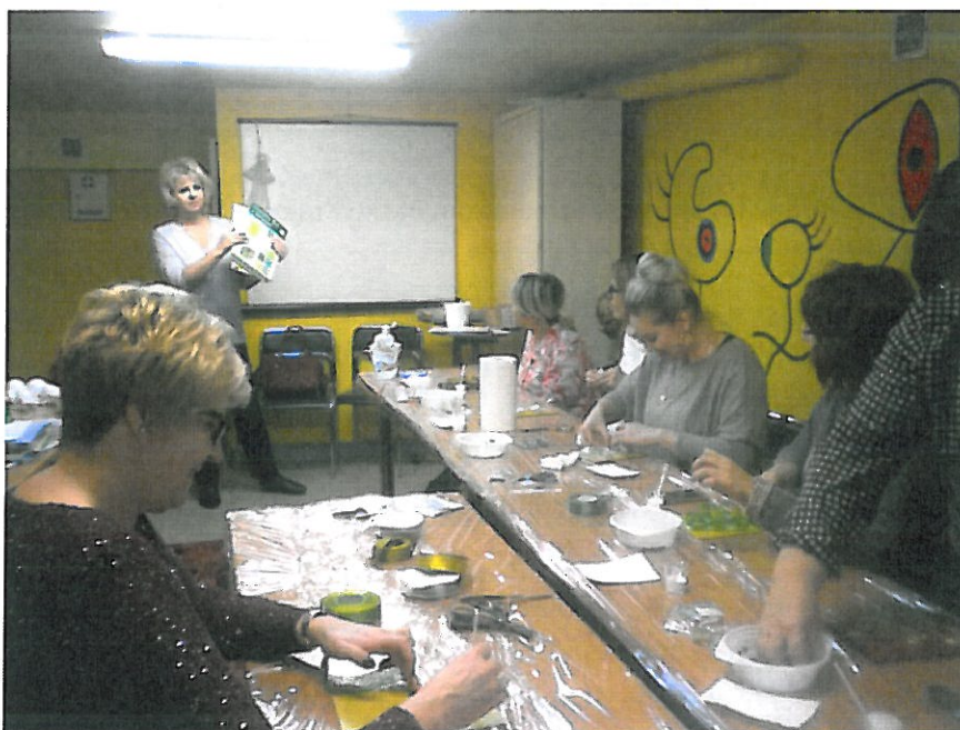
15. Warsztaty szkoleniowe z nauczycielami, Fot. Pani Ewa Kobelska

W zajęciach uczestniczyło 15 nauczycieli z 7 szkół podstawowych, zajęcia trwały 6 godz.